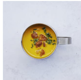
Today's Cup Soup 本日のカップスープ ¥420