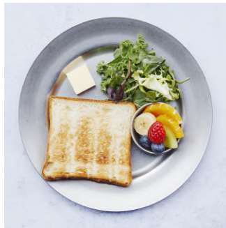
Toast Set with mini salad & fruits トーストセット、ミニサラダとフルーツ付き ¥560