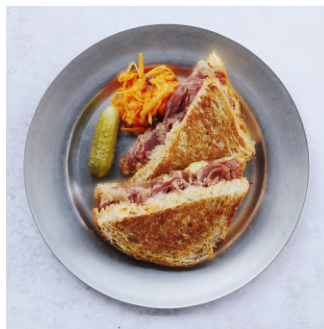
Hot Pastrami Sandwich ホットパストラミサンドイッチ ¥1,280