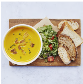
Morning Soup Set with mini salad & toasted bread モーニングスープセット、 ミニサラダとブレッド付き ¥980