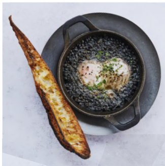
Lentil & Sausage Stew with toasted baguette レンズ豆とソーセージのシチュー、 バゲット付き ¥1080