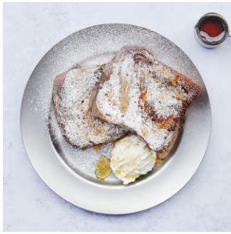
Brioche French Toast with salted whipped cream ブリオッシュフレンチトースト、 塩ホイップクリーム ¥880