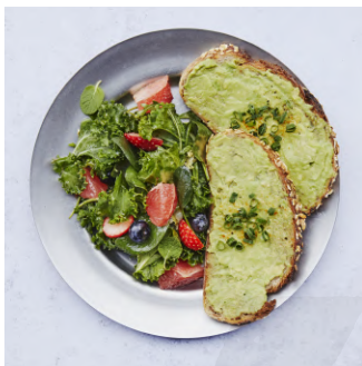
Avocado Toast with fruit salad アボカドトースト、フルーツサラダ ¥1,180