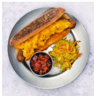
Sausage Egg Muffin Dog ソーセージエッグマフィンドッグ ¥1,180