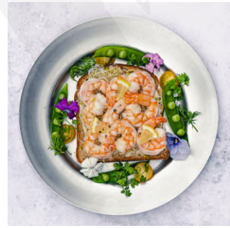
Shrimp Open Sandwich with abchovy mayonnaise エビのオープンサンドイッチ アンチョビマヨネーズ ¥1,380