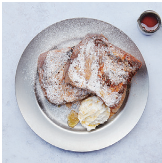
Brioche French Toast with salted whipped cream 湯種ブリオッシュフレンチトースト 塩ホイップクリーム ¥1,280