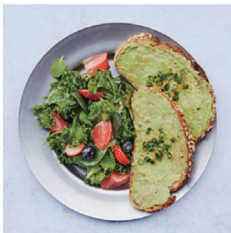
Avocado Toast with fruit salad アボカドトースト、フルーツサラダ ¥1,500