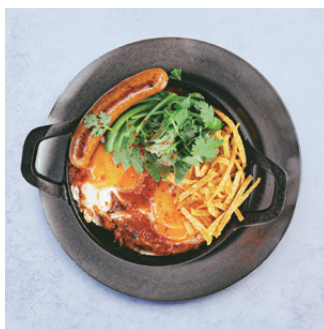
No.4 style Huevos Rancheros No.4スタイル ウェボスランチェロス ¥1,800