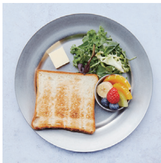
Toast Set with mini salad & fruits トーストセット、ミニサラダとフルーツ付き ¥680