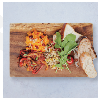
Today's Deli Plate with toasted bread 3種のデリプレート、ブレッド付き ¥1,480