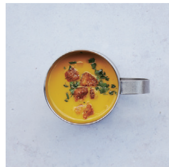
Today's Cup Soup 本日のカップスープ ¥460