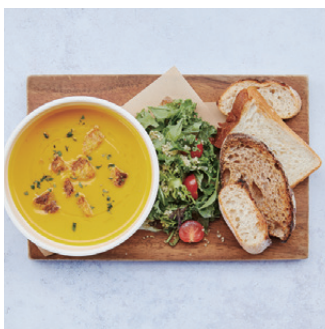
Morning Soup Set with mini salad & toasted bread モーニングスープセット ミニサラダとブレッド付き ¥1,480