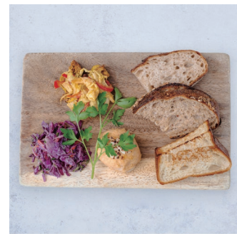
Today's Deli Plate with toasted bread 3種のデリプレート、ブレッド付き ¥1,680