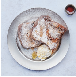
Brioche French Toast with salted whipped cream 湯種ブリオッシュフレンチトースト 塩ホイップクリーム ¥1,680