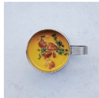
Today's Cup Soup 本日のカップスープ ¥520