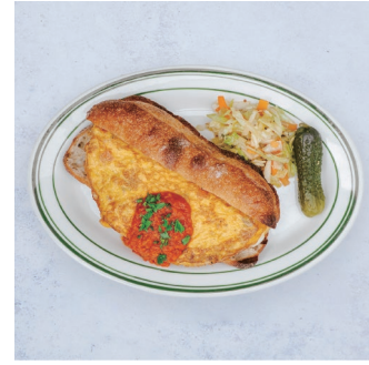
Omelette Baguette Sandwich with coleslaw シラスのスパニッシュオムレツバケットサンド スパイシートマトソース ¥1,780