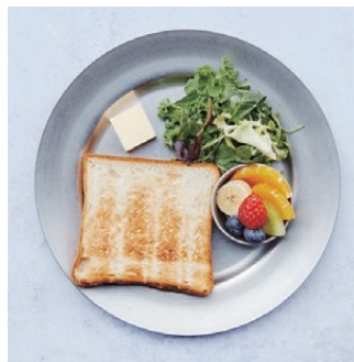
Toast Set with mini salad & fruits トーストセット、ミニサラダとフルーツ付き ¥680