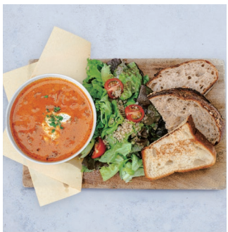
Morning Soup Set with mini salad & toasted bread モーニングスープセット ミニサラダとブレッド付き ¥1,680