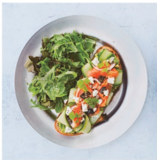
Avocado Toast smoked salmon, cucumbers, feta cheese スノーカントリープレッド アボカドトースト ¥1,780