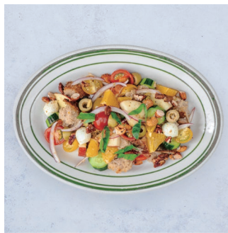
Sourdough Panzanella Salad スノーカントリープレットの パンツァネラサラダ ¥1,580