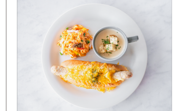
Custom Plate カスタムプレート お好きなパンやデリを組み合わせ、ワンプレートでお楽しみいただけます。 ※写真の組み合わせはサンプルです。