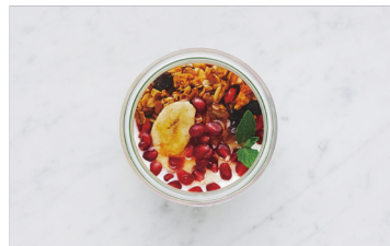
Fruits Granola with Yogurt ¥600 フルーツグラノーラヨーグルト