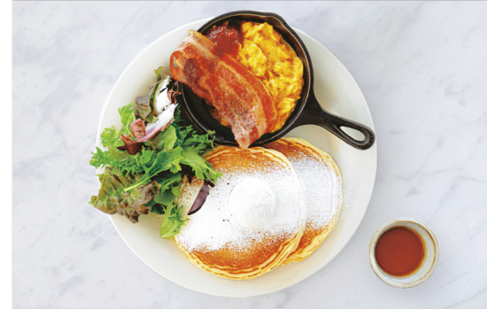
Buttermilk Pancake Plate ¥1,700 バターミルクパンケーキプレート