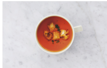
Today's Soup S ¥520 本日のスープ R ¥780