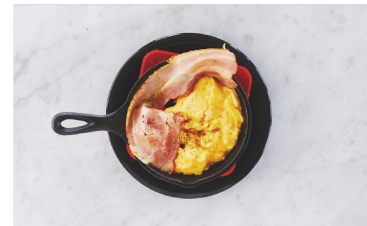
Cheese Scrambled Eggs & Bacon ¥500 チーズスクランブルエッグとベーコン