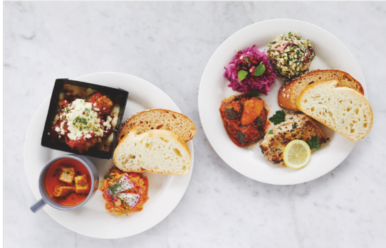
[ショーケースの中から好きなデリ又はスモールスープをお選びいただけます] Deli Plate 3種 ¥1,280~ Your choice of Delis + Bread 4種 ¥1,580~ お好きなデリ+パン2種(ランダム)