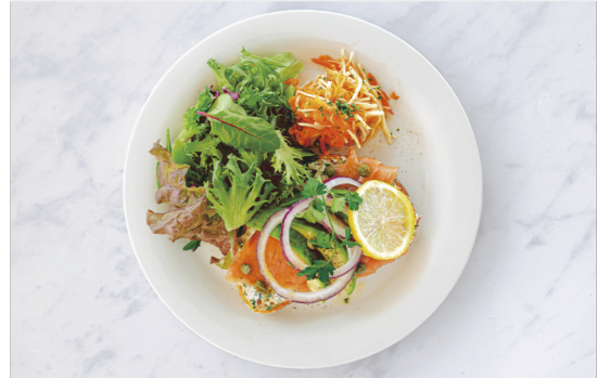
Salmon Trout & Avocado Tartine ¥1,600 サーモントラウトとアボカドのタルティエヌプレート