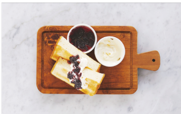
Toast w/ Homemade Jam & Whipped Butter ¥450 トースト+自家製ジャムとホイップバター