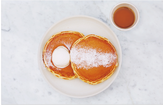
Buttermilk Pancake ¥1,200 バターミルクパンケーキ